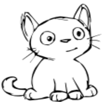
6. Появление друга - помощника