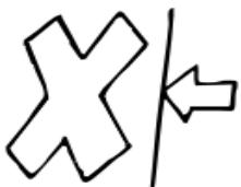
4. Нарушение запрета