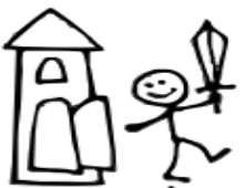
5. Герой покидает дом